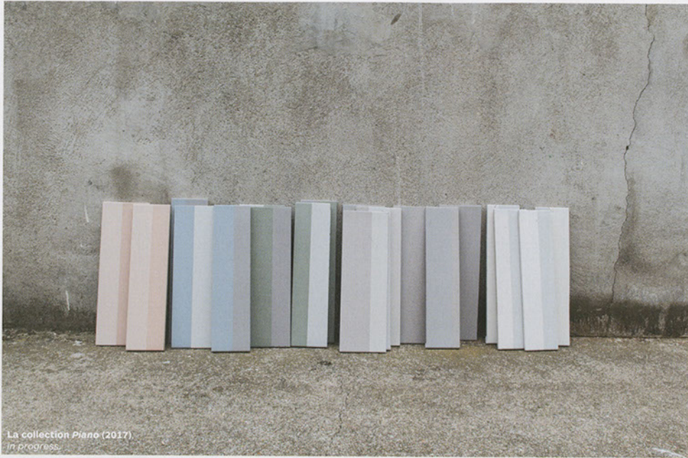
La collection Piano (2017) In progress.

Le dessin même de chaque élément a ici moins prévalu que pour Pico . C'est l'effet d'ensemble, dans un espace qui a compté. La peau est plus mécanique. Le losange est traité sous différentes formes : en carreau, puis développé au mur, en extrudant géométriquement le triangle depuis le sol, pour jouer de manière assez spectaculaire avec la lumière, tout en restant assez calme. Et pour Piano , l'approche est encore différente. Elle fait écho à des recherches développées sur d'autres sujets, notamment des tapis pour la marque Nanimarquina, sur la question du motif. L'idée étant de produire un ensemble brouillé. Je m'explique : les carreaux sont rectangulaires et bicolores (une couleur de fond et une