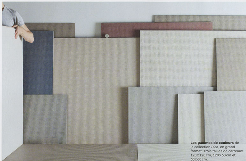
Les gammes de couleurs de la collection Pico, en grand format. Trois tailles de carreaux: 120 x 120 cm, 120 x 60 cm et 60 x 60 cm.

A.À.V.: Comment avez-vous procédé pour la conception de Pico , votre première collection pour Mutina en 2011?